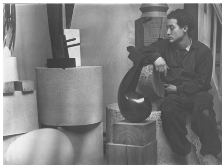
14 Isamu Noguchi in seinem Atelier in Gentilly bei Paris, 1927