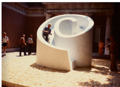
13 Noguchi testet Slide Mantra bei Isamu Noguchi: What is Sculpture? , US-Pavillion, Biennale Venedig, 1986

Alle Urheberrechte bleiben vorbehalten. Die Bildlegende muss vollständig übernommen und das Werk wie abgebildet reproduziert werden. Die Bilder dürfen nur im Zusammenhang mit der Berichterstattung zur Ausstellung Isamu Noguchi verwendet werden.