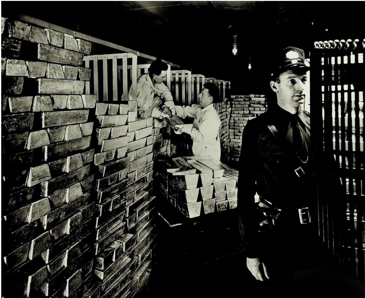
Anonyme, Barres d'argent dans le coffre-fort de Kodak , 1945. Avec l'aimable autorisation d'Eastman Kodak Company.