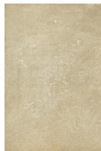
© Susanne Kriemann, Falsche Kamille (Fausse camomille), de la série PechblendeGessenwiese , Kanigsberg, 2017–2020, Museum für Kunst und Gewerbe, Hambourg