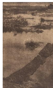
Theodor et Oscar Hofmeister, Fleurs de tourbière , 1897, Museum für Kunst und Gewerbe Hamburg.