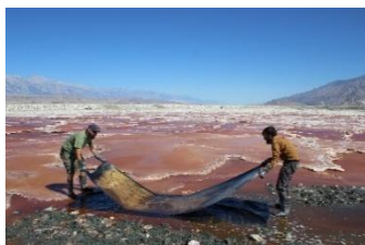
© Optics Division of the Metabolic Studio (Lauren Bon, Tristan Duke et Richard Nielsen) Panorama du lac Owens 1 (développé sur le lit du lac), 2013

Les images de presse figurant dans ce dossier sont libres de droits pour la durée de l'exposition. Elles ne peuvent pas être recadrées, modifiées ou retouchées. Toute reproduction, hormis les vues d'exposition, doit être accompagnée des légendes et copyrights complets indiqués ci-dessous.