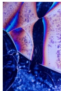
© Lisa Barnard, Écran de téléphone défectueux , déchets électroniques, Shenzhen, Chine, 2018.