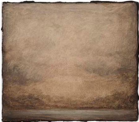
02. Lucas Arruda Untitled (from the Deserto-Modelo series), 2016 Oil on canvas © Lucas Arruda Courtesy the artist, David Zwirner and Mendes Wood DM Photography by Everton Ballardin