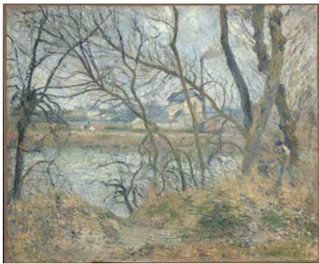
11. Camille Pissarro Bords de l'Oise, près de Pontoise, temps gris, 1878 Huile sur toile H. 54,5 ; L. 65,5 cm. Collection Musée d'Orsay Legs Antonin Personnaz, 1937