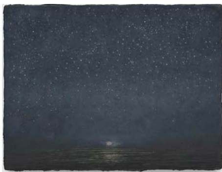
15. Lucas Arruda Untitled (from the Deserto-Modelo series), 2023 Oil on canvas © Lucas Arruda Courtesy the artist, David Zwirner and Mendes Wood DM Photography by Chase Barnes