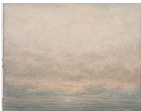
05. Lucas Arruda Untitled (from the Deserto-Modelo series), 2023 Oil on canvas © Lucas Arruda Courtesy the artist and David Zwirner Photography by Chase Barnes