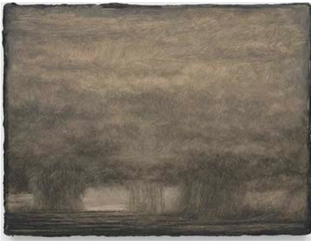
16. Lucas Arruda Untitled (from the Deserto-Modelo series), 2023 Oil on canvas © Lucas Arruda