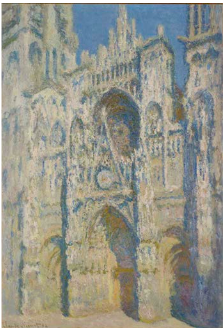
22. Claude Monet La Cathédrale de Rouen. Le Portail et la Tour Saint-Romain, plein soleil , 1893 Huile sur toile H. 107,0 ; L. 73,5 cm. Collection Musée d'Orsay Legs comte Isaac de Camondo, 1911