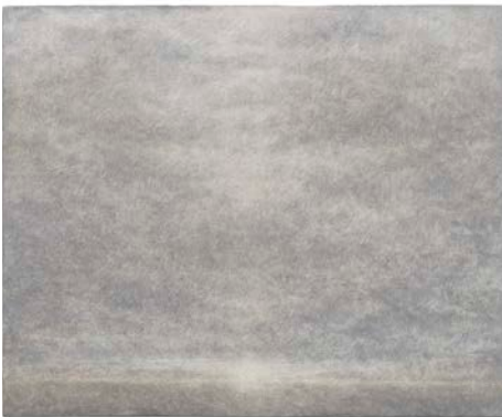
03. Lucas Arruda Untitled (from the Deserto-Modelo series), 2018 Oil on canvas © Lucas Arruda Courtesy the artist, David Zwirner and Mendes Wood DM Photography by Everton Ballardin