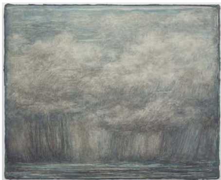
14. Lucas Arruda Untitled (from the Deserto-Modelo series), 2021 Oil on canvas © Lucas Arruda Courtesy the artist, David Zwirner and Mendes Wood DM Photography by Claire Dorn