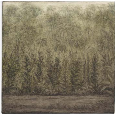
13. Lucas Arruda Untitled (from the Deserto-Modelo series), 2023 Oil on canvas © Lucas Arruda Courtesy the artist, David Zwirner and Mendes Wood DM Photography by Chase Barnes