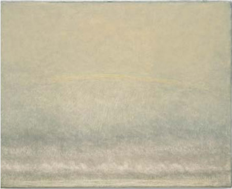
18. Lucas Arruda Untitled (from the Deserto-Modelo series), 2021 Oil on canvas Photography by Chase Barnes Courtesy the artist, David Zwirner and Mendes Wood DM