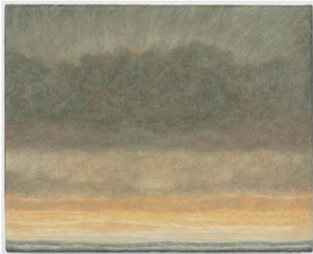
04. Lucas Arruda Untitled (from the Deserto-Modelo series), 2022 Oil on canvas © Lucas Arruda Courtesy the artist, David Zwirner and Mendes Wood DM Photography by Claire Dorn