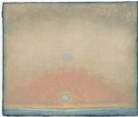
12. Lucas Arruda Untitled (from the Deserto-Modelo series), 2024 Oil on canvas © Lucas Arruda Courtesy the artist, David Zwirner and Mendes Wood DM Photography Kerry McFate