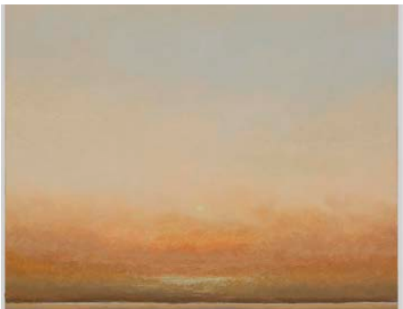
19. Lucas Arruda Untitled (from the Deserto-Modelo series), 2025 Oil on canvas Courtesy the artist, David Zwirner and Mendes Wood DM Photography by Everton Ballardin