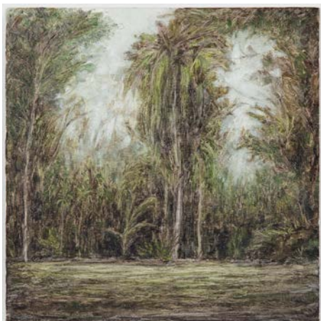
21. Lucas Arruda Untitled (from the Deserto-Modelo series), 2013 Oil on canvas © Lucas Arruda Courtesy the artist, David Zwirner and Mendes Wood DM Photography by Everton Ballardin