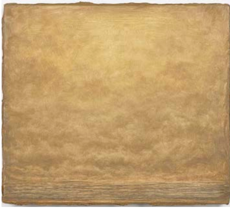
01. Lucas Arruda Untitled (from the Deserto-Modelo series), 2016 Oil on canvas © Lucas Arruda Courtesy the artist, David Zwirner and Mendes Wood DM Photography by Anna Arca