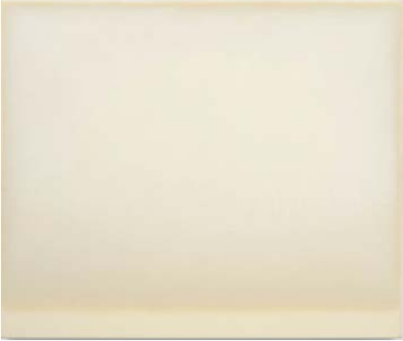
17. Lucas Arruda Untitled (from the Deserto-Modelo series), 2024 Oil on linen Private collection