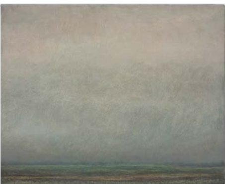
20. Lucas Arruda Untitled (from the Deserto-Modelo series), 2022 Oil on canvas Private collection Courtesy the artist, David Zwirner and Mendes Wood DM Photography by Claire Dorn