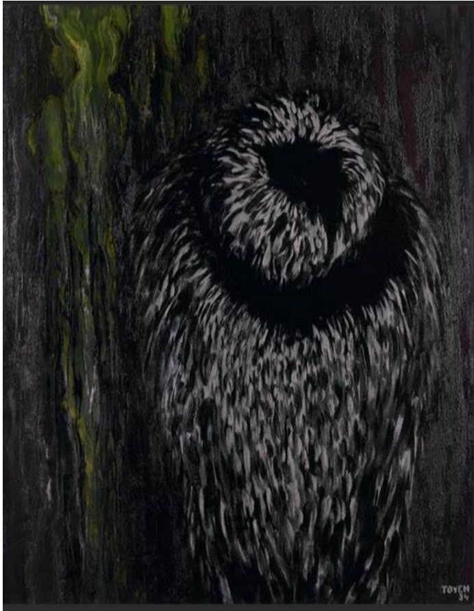
Toych, Stimme des Waldes I ( Voice of the Forest I ) | ( la Voix de la Fôret I ) | ( Stem van het Bos I ) (1934)

Oil on canvas | huile sur toile | olieverf op doek