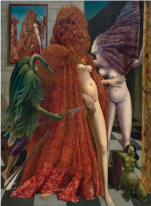
Max Ernst, Attirement of the Bride | La Toilette de la mariée | Het aankleden van de bruid (1940)

Oil on canvas | huile sur toile | olieverf op doek (129,6 x 96,3 cm)