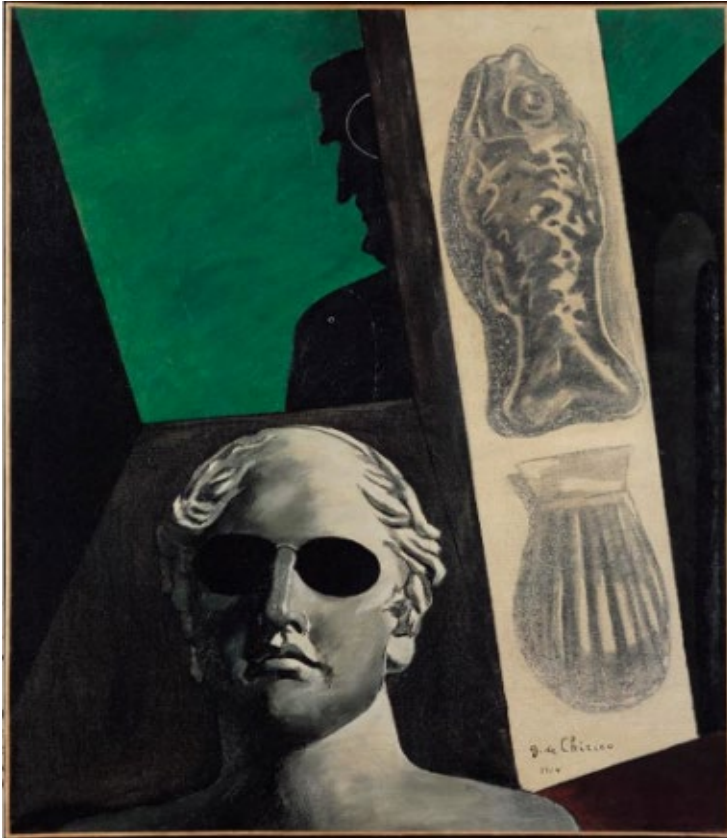
Giorgio De Chirico, Premonitory portrait of Guillaume Apollinaire | Portrait [prémonitoire] de Guillaume Apollinaire | Een voorspellend portret van Guillaume Apollinaire [1914]

Oil and Charcoal on canvas | huile et fusain sur toile | olieverf en houtskool op doek [81,5 x 65 cm]