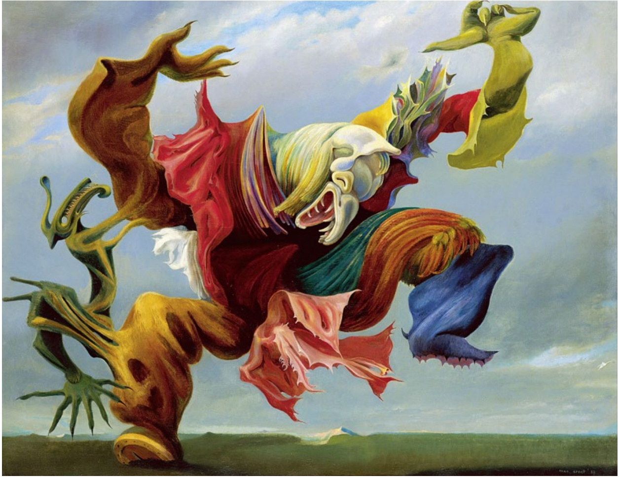
Max Ernst, The Fireside Angel (The Triumph of Surrealism) | L'ange du foyer (Le triomphe du surréalisme) [1937]