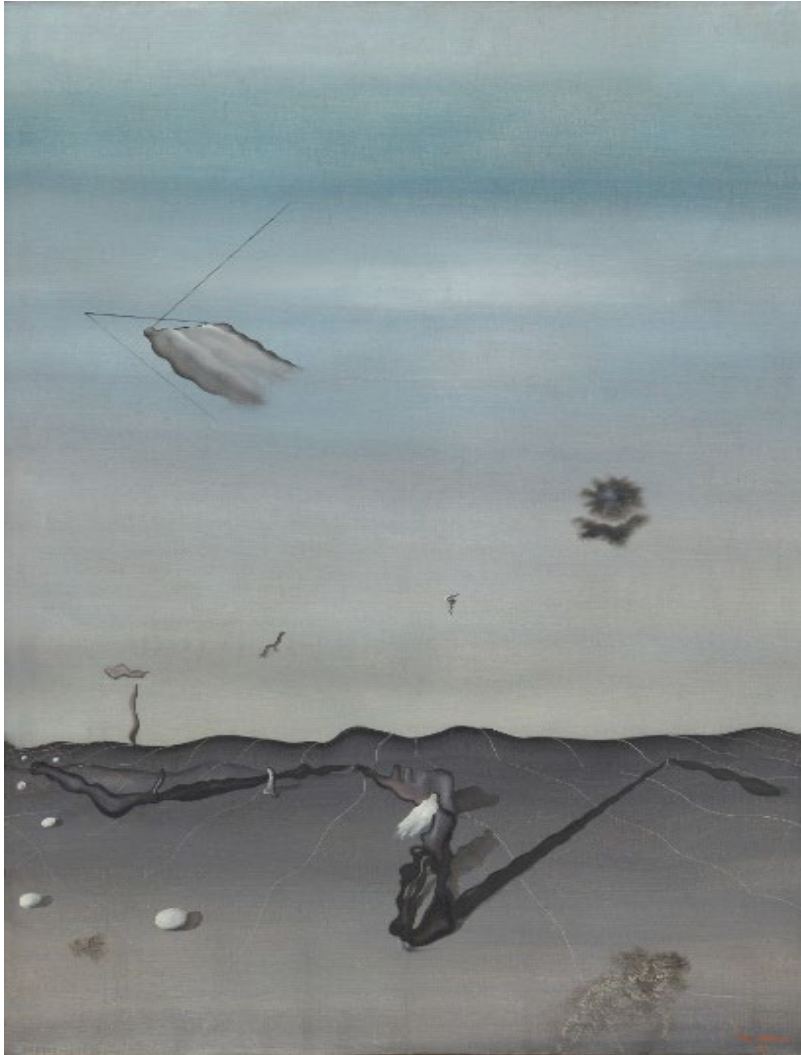
Yves Tanguy, The Plane | L'Avion | Het vliegtuig (1929)

Oil on canvas | huile sur toile | olieverf op doek (81 x 60 cm)