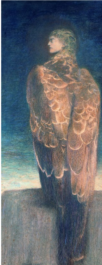
Fernand Khnopff, Sleeping Medusa | La Méduse endormie | Slapende Medusa (1896)

Pastel on paper | pastel sur papier | pastel op papier (72 x 29 cm)