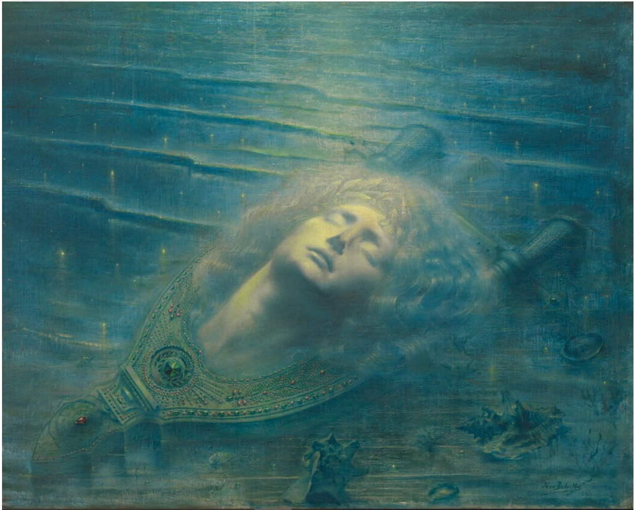
Jean Delville, The Dead Orpheus | Orphée mort | De dode Orpheus (1893)

Oil on canvas | huile sur toile | olieverf op doek [79,3 x 99,2 cm]