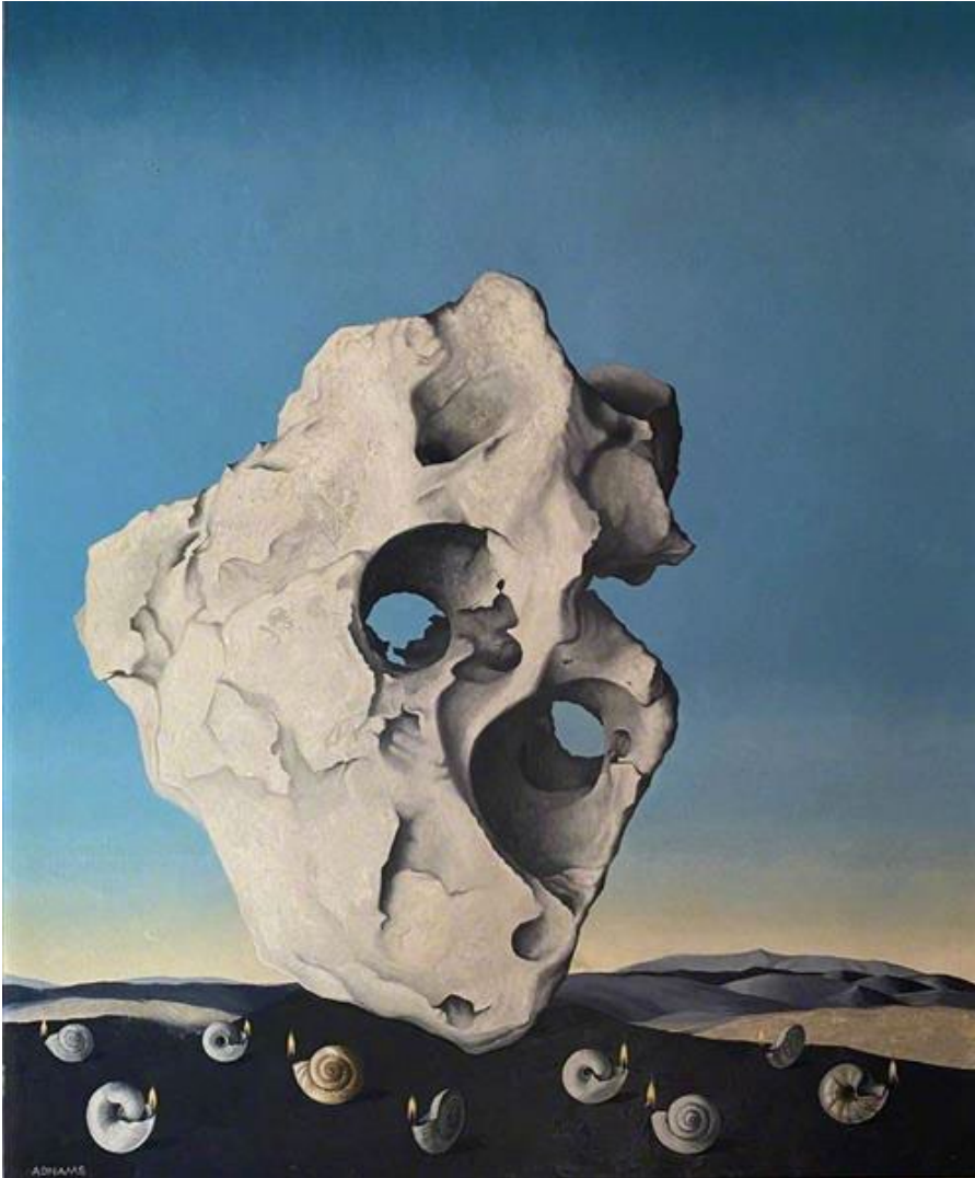
Marion Adnams, A Candle of Understanding in Thine Heart | ( Une bougie de compréhension dans ton cœur ) | ( Een kaars van begrip in uw hart ) (1964)

Tempera on wood - Tempera sur panneau – Tempera op panel (58,42 x 48,2)