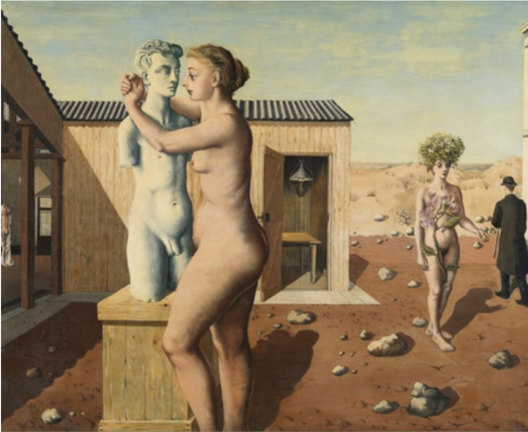
Paul Delvaux, Pygmalion [1939]

Oil on canvas | huile sur toile | olieverf op doek [117 x 148 cm]