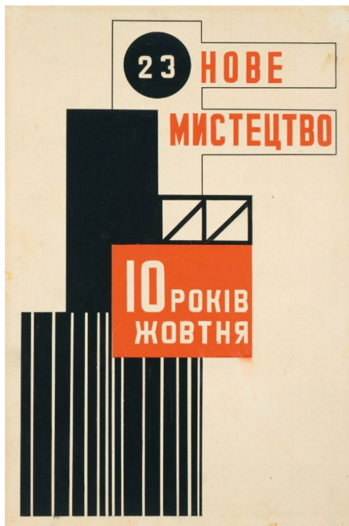
Vasyl Yermilov (1894–1968), Nove Mystetstvo (Nieuwe Kunst) , tijdschrift omslagontwerp | Nove Mystetstvo (Nouvel Art) , design de la couverture de la revue | Nove Mystetstvo (New Art) , Journal cover design (1927)

Oost-Indische inkt en gouache op papier | Encre de Chine et gouache sur papier | Indian ink and gouache on paper