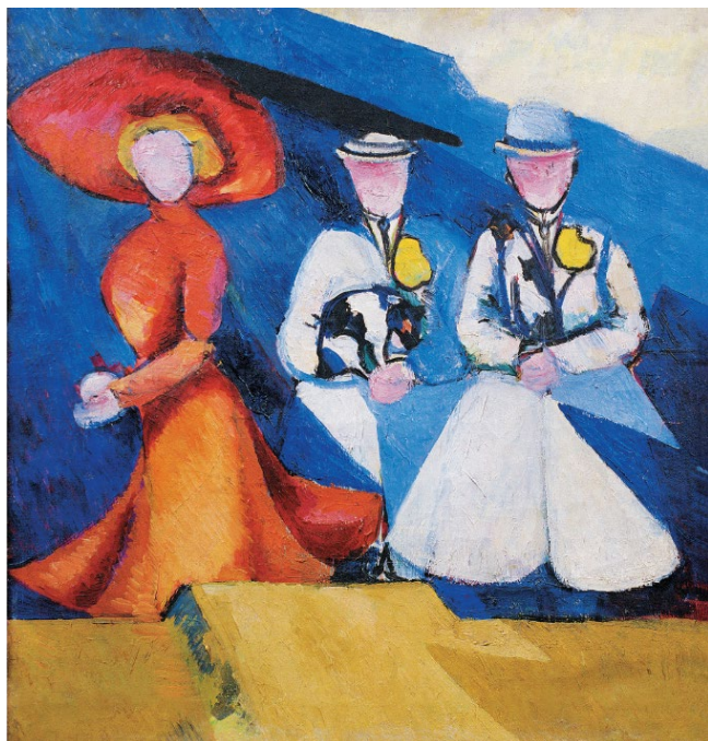
Alexandra Exter (1882 – 1949), Drie vrouwelijke figuren | Trois personnages féminins | Three Female Figures (1909-1910)

Olieverf op doek | Huile sur toile | Oil on canvas