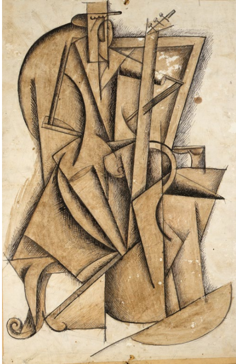
Marko Epshtein (1899–1949), Cellist | Violoncelliste | Cellist (ca. 1920)

Oost-Indische inkt en aquareel op papier gekleefd op karton | Encre de Chine et aquarelle sur papier collé sur carton | Indian ink and watercolour on paper pasted on cardboard