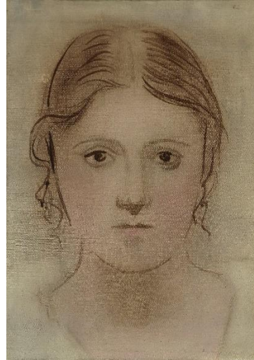
Pablo Picasso (1881-1973) Retrato de Olga 10 noviembre 1923 Óleo sobre lienzo 33 × 24 cm Museo Picasso Málaga. Depósito del Ministerio de Cultura