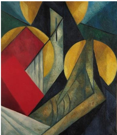
Marius de Zayas (1880-1961) Pietà Rivoiranche, 1938 Óleo sobre lienzo 78 × 68 cm Archivo Marius de Zayas