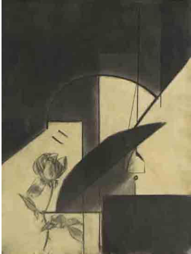
Marius de Zayas (1880-1961) Caricatura semi abstracta de Pablo Picasso c. 1915 Fotograbado en color 48 × 31,5 cm Archivo Marius de Zayas