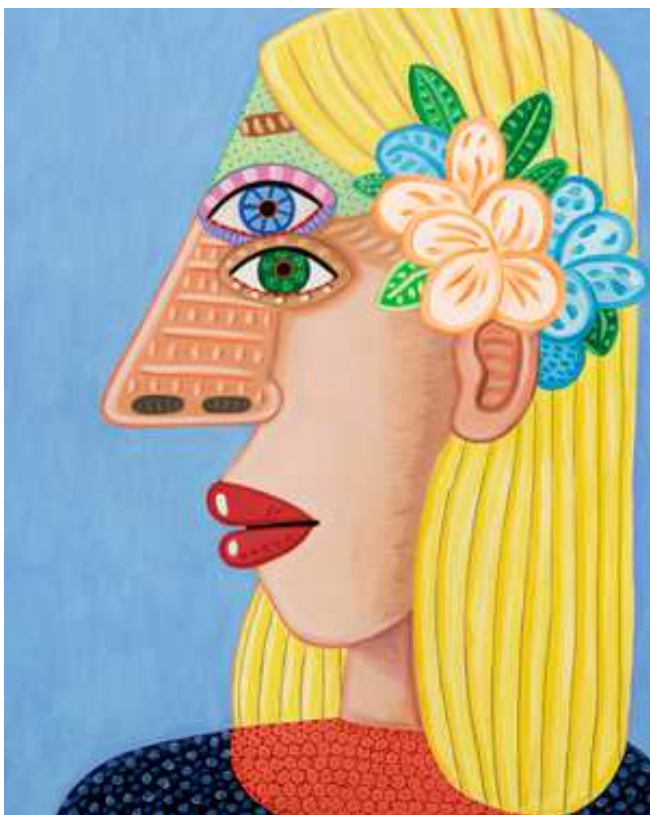
Brian Calvin (1969) Fiore [Flores], 2023 Acrílico sobre lienzo, 101,6 × 81,3 cm

ChanWoo Son collection – Cortesía del artista y Almine Rech © Brian Calvin – Cortesía del artista y Almine Rech