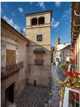
B © Museo Picasso Málaga