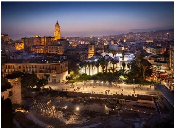
A © Museo Picasso Málaga