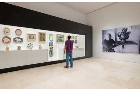
G © Museo Picasso Málaga