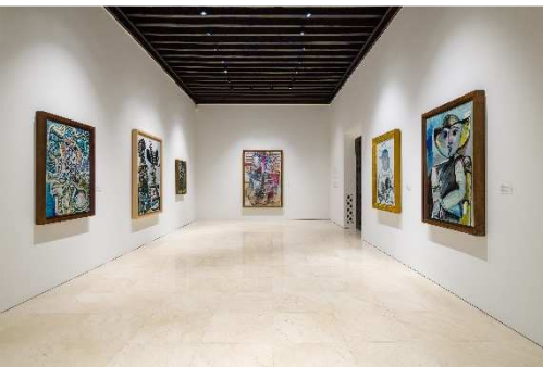
F © Museo Picasso Málaga