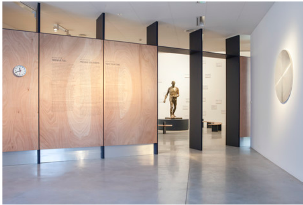
Zaalzicht 'Neem je Tijd', M Leuven, foto: © Miles Fischler voor M Leuven