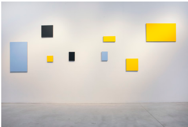
Zaalzicht 'Neem je Tijd', M Leuven