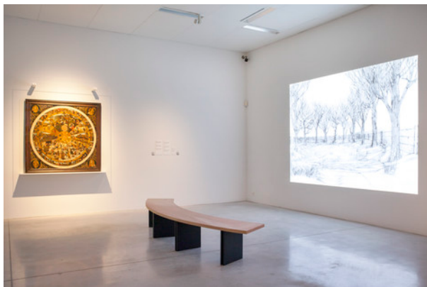
Zaalzicht 'Neem je Tijd', M Leuven