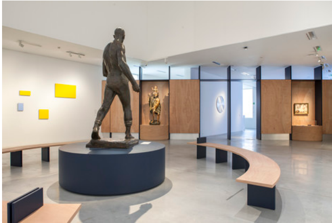
Zaalzicht 'Neem je Tijd', M Leuven