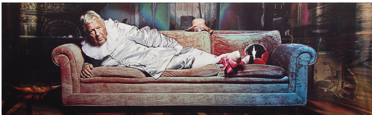
Miriam Bäckström , The Opposite of Me Is I , 2011, Jacquard-Wandteppich (Seide, Wolle, Baumwolle, Acryl und Lurex auf Trevira CS), 290 x 970 cm, Courtesy die Künstlerin

Kunstmuseum Thun Thunerhof, Hofstettenstrasse 14, 3602 Thun T +41 (0)33 225 84 20 / F +41 (0)33 225 89 06 kunstmuseum@thun.ch , www.kunstmuseumthun.ch