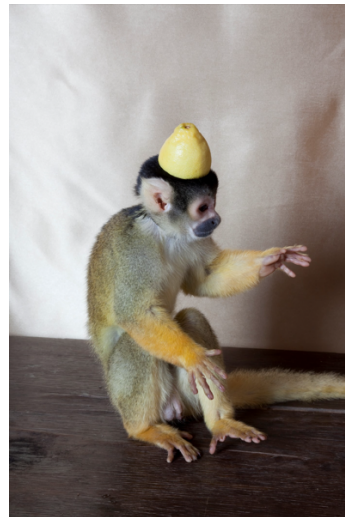
Istvan Balogh Monkey with Lemon , 2009 Lambda-Print, 1–4 60 x 40 cm