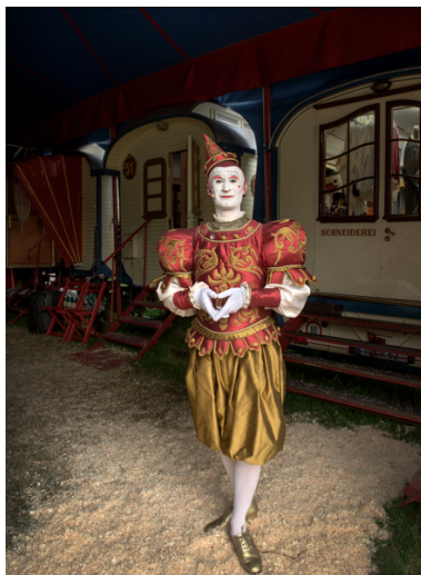
Michael Dannenmann Fulgenci Mesters Bertran – Weissclown Gensi , 2016 C-Print, 39.5 x 29.3 cm