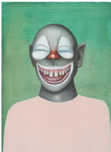
Francisco Sierra Clown II (aus: Facebook), 2008 Öl auf Karton, 21 x 15.5 cm Kunstmuseum Bern, Sammlung Stiftung GegenWART

Wir bitten Sie, bei der Verwendung des Bildmaterials stets die hier angegebenen Bildunterschriften und -nachweise anzufügen. Druckfähiges Bildmaterial finden Sie unter http://www.kunstmuseumthun.ch/medien