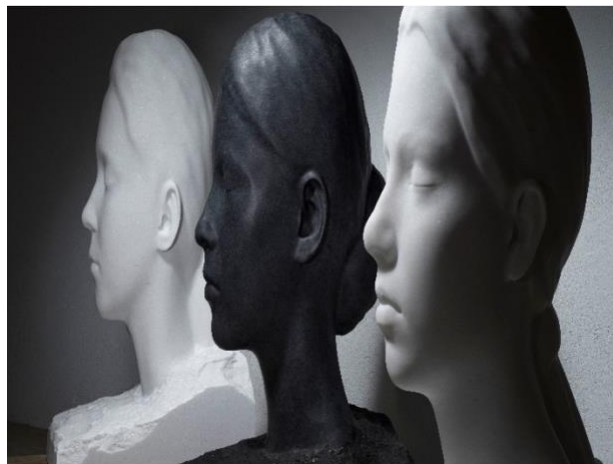
Jaume Plensa, Minna's World III , 2021 (Marbre) Flora , 2021 (Granit), Martina's World II , 2021 (Marbre) © Jaume Plensa.

13 rue de Téhéran 38 avenue Matignon 75008 Paris