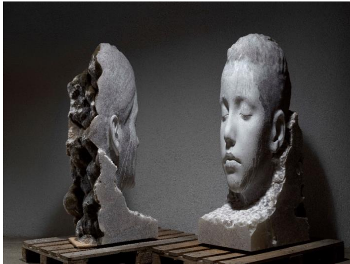
© Jaume Plensa. Photo : FotoGasull. Courtesy Galerie Lelong & Co.

Un recueil de quatre textes de Catherine Millet sur Jaume Plensa, Le Silence du scribe , est publié par la Galerie Lelong & Co. en mai 2022.