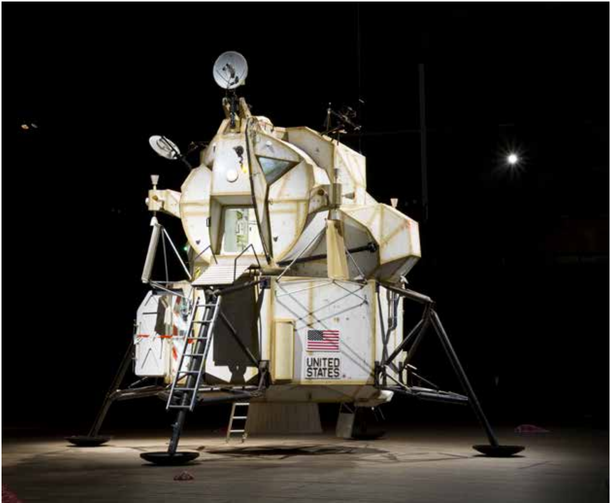
Tom Sachs, Landing Excursion Module (LEM), 2007, Space Program: Mars - Park Avenue Armory, New York, 2012. Mixed Media, 277H x 263W x 263D inches. Photo: Genevieve Hanson © Tom Sachs