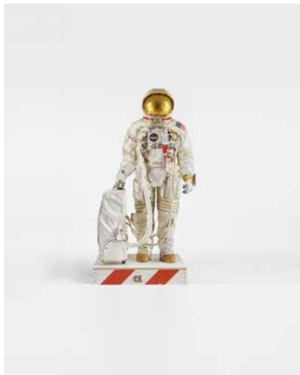
Tom Sachs, Sam's Suit, 2019, Mixed Media, 142.5H x 70W x 70D inches.

Deichtorhallen Hamburg, Angelika Leu-Barthel Deichtorstr. 1-2, 20095 Hamburg, Tel. 040-3210 3250, presse@deichtorhallen.de