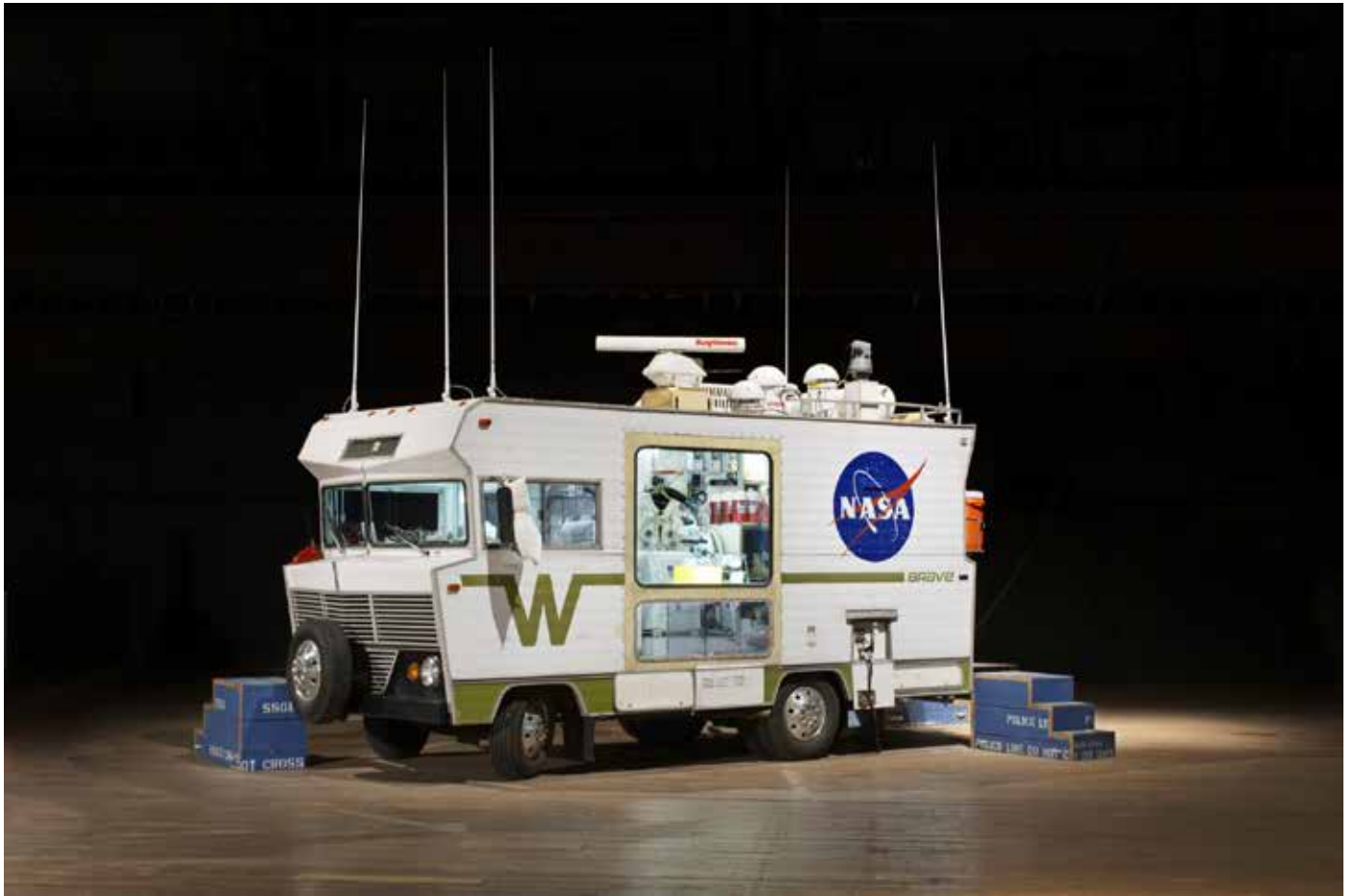
Tom Sachs, Mobile Quarantine Facility (MQF), 2011, 1972 Winnebago Brave, Mixed Media, 216H x 90W x 229D inches. Photo: Genevieve Hanson © Tom Sachs