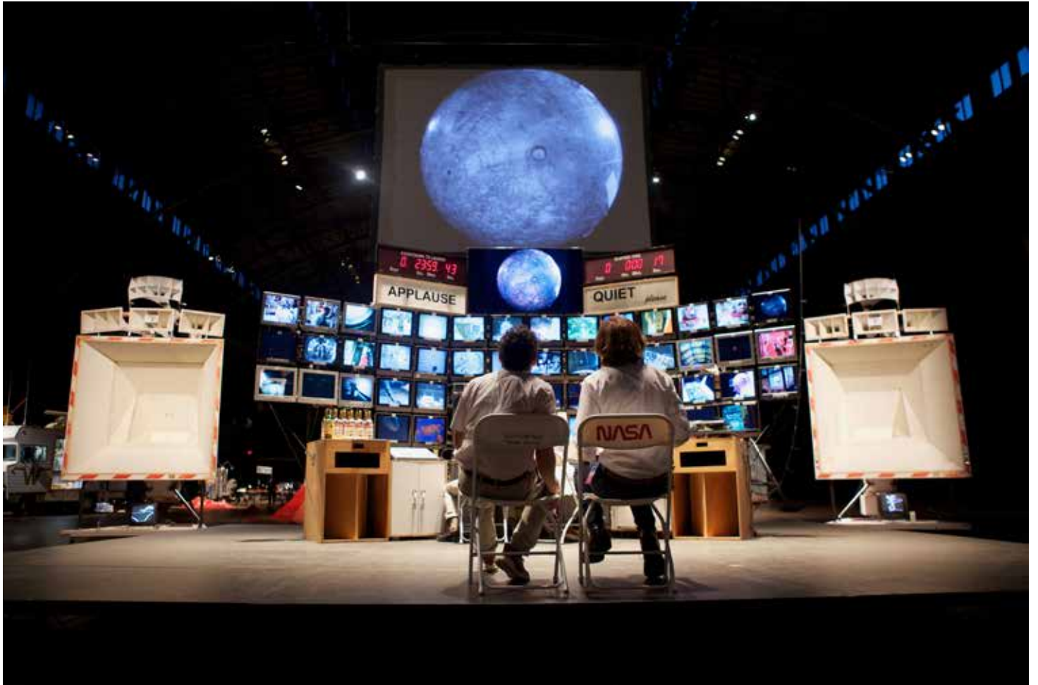
Tom Sachs. Mission Control Center (MCC), 2007-2016, Space Program: Mars - Park Avenue Armory, New York, 2012, Mixed Media, 117.3 H x 193.125 W x 59.875 D inches.