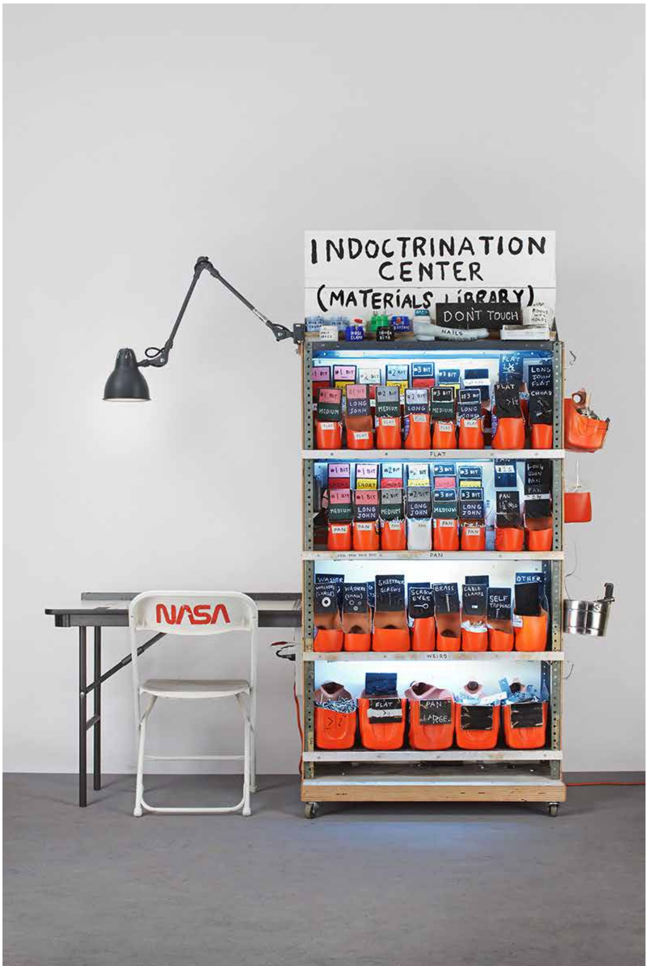
Tom Sachs, Indoctrination Center (Materials Library) , 2012, Mixed Media, 82H x 80W x 27.25D inches. Photo: Genevieve Hanson © Tom Sachs