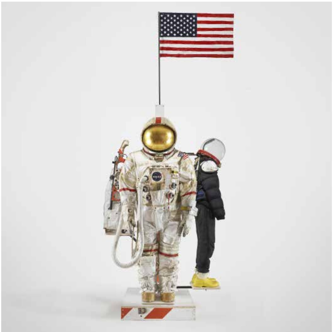
Tom Sachs, Mary's Suit, 2019, Mixed Media, 142.5H x 70W x 70D inches. Foto: Genevieve Hanson © Tom Sachs