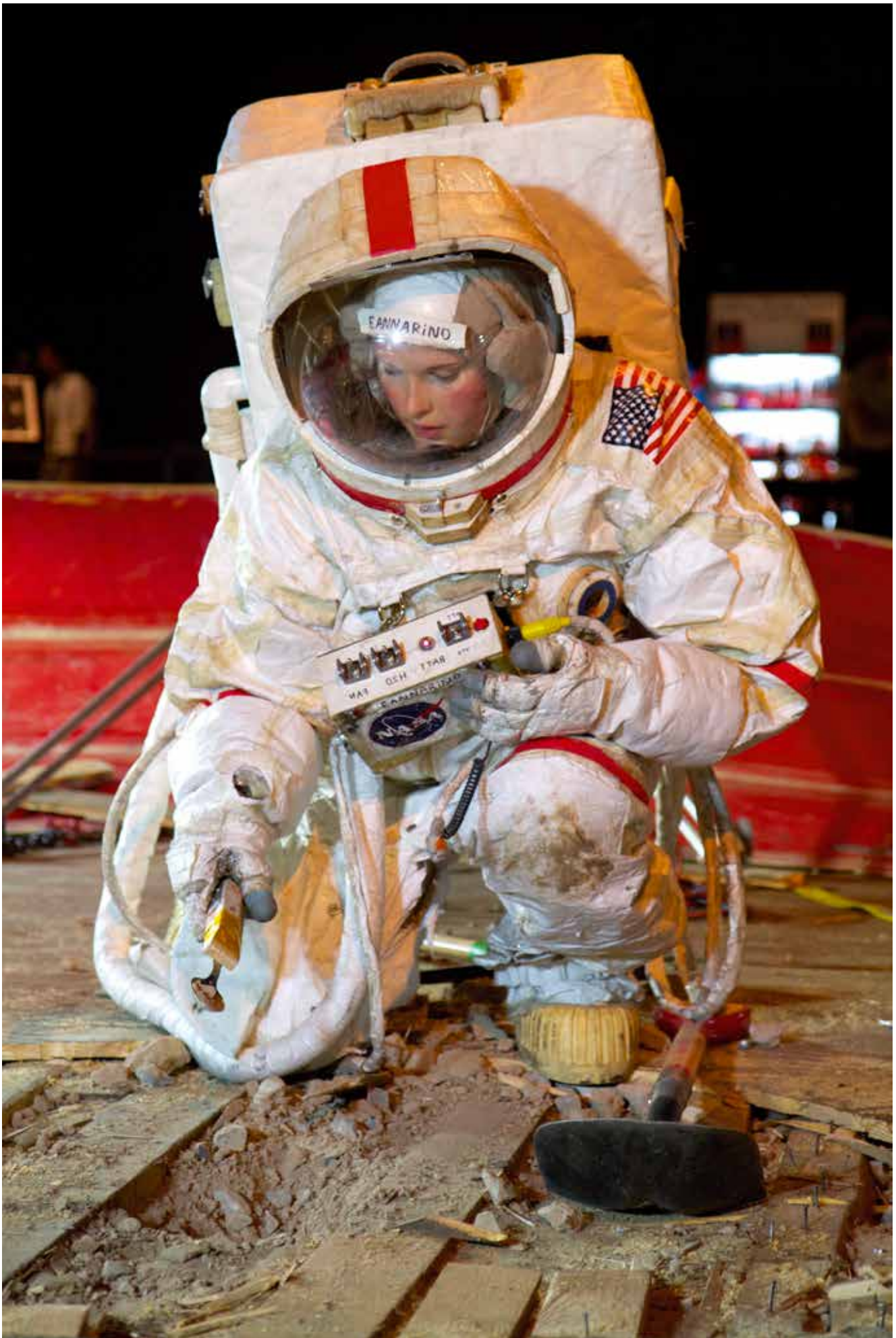
Tom Sachs, Space Program: Mars - Park Avenue Armory, New York, 2012, Context: Commander Ennarino extracting a sample at the dig site on Mars. Photo: Genevieve Hanson © Tom Sachs