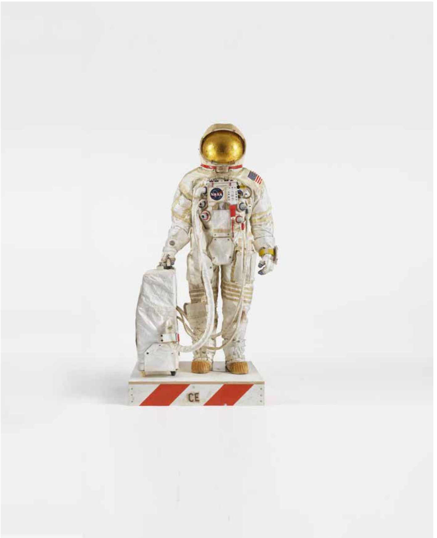
Tom Sachs, Sam's Suit, 2019, Mixed media, 71 H x 35 W x 31 D inches Foto: Genevieve Hanson © Tom Sachs