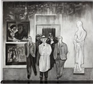
Marc Bauer (*1975), Sphinx , 1931, 1935/1947, 2014 Kohle auf Wand, Bleistift, Buntstift auf Papier, variabel Aargauer Kunsthaus Mit Genehmigung des Künstlers © Marc Bauer