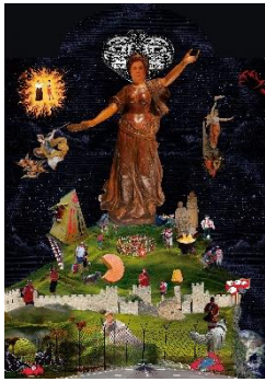
Guerreiro do Divino Amor (*1983), Le Miracle d'Helvetia , 2022 [Detail der Leuchttafel Desideria Patria , 100 x 70 x 10 cm] Mehrteilige Multimediainstallation, Masse variabel Coll. Fonds cantonal d'art contemporain, Genève Mit Genehmigung des Künstlers © Guerreiro do Divino Amor