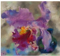
Augusto Giacometti (Stampa 1877 - 1947 Zürich) Orchidee, 1927 Öl auf Leinwand, 22.5 × 24.5 cm Privatbesitz