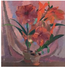
Augusto Giacometti (Stampa 1877 - 1947 Zürich) Amaryllis, 1947 Öl auf Leinwand, 100.7 × 96.2 cm Aargauer Kunsthaus Aarau / Schenkung aus Schweizer Privatbesitz