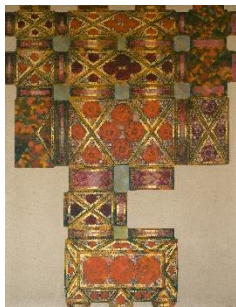
Augusto Giacometti (Stampa 1877 - 1947 Zürich) Entwurf zur Gewölbemalerei im Amtshaus I der Stadt Zürich, 1922 Öl auf Leinwand auf Leinwand aufgezogen, 235 × 182 cm Kunstsammlung Stadt Zürich