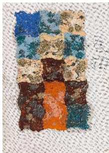
Augusto Giacometti (Stampa 1877 - 1947 Zürich) Farbabstraktion mit fünfzehn Feldern, um 1900 Öl auf Leinwand, 16.5 × 10 cm Privatsammlung