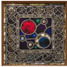
Augusto Giacometti (Stampa 1877 - 1947 Zürich) Das Leben auf dem Lande (zweites Fenster, linker Flügel), 1920 Vier Teile von je 21 × 21 cm; Fensterflügel 159,5 × 50 cm Inv. 15041. 11, Stiftung für Kunst, Kultur und Geschichte, Winterthur