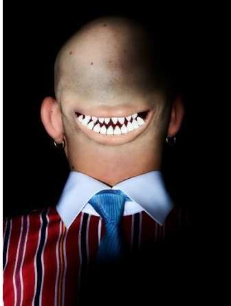
James Bantone, Fool of the Month , 2022 C-print, 40 x 30 cm Mit Genehmigung des Künstlers und Karma International, Zürich © James Bantone