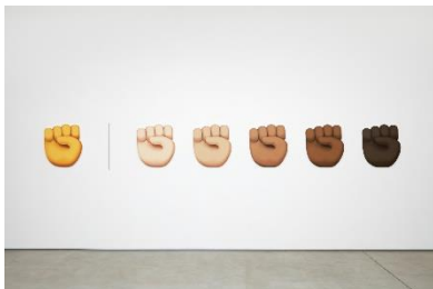
Jonathan Horowitz, Power , 2019 PVC-Board, 65.7 x 509 cm Mit Genehmigung des Künstlers und Sadie Coles HQ, London. © Jonathan Horowitz Foto: Robert Glowacki