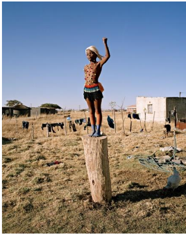
Namsa Leuba, Power , aus der Serie Zulu Kids , 2014 Inkjet-Print, 42 x 33.6 cm