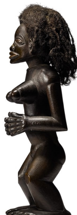
Statue princière, Chokwe, Angola, 1.500.000 - 2.000.000 €