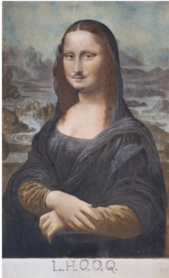
Marcel Duchamp L.H.O.O.Q.

1919, readymade rectifié Collection particulière © succession Marcel Duchamp / ADAGP, Paris 2014