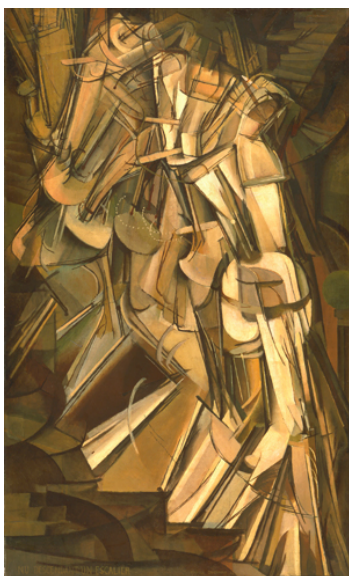
Marcel Duchamp Nu descendant l'escalier n°2

1911, huile sur toile, 65.70 x 50.20 cm The Vera and Arturo Scharz Collection of Dada and Surrealist Art in the Israel Museum Collection, Jérusalem © succession Marcel Duchamp / ADAGP, Paris 2014