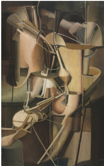
Marcel Duchamp La Mariée

1912, huile sur toile, 89.5 x 55 cm Philadelphia Museum of Art, The Louise and Walter Arensberg Collection, 1950 © succession Marcel Duchamp / ADAGP, Paris 2014