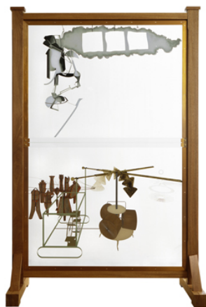
Marcel Duchamp Le Grand Verre (La Mariée mise à nu par ses célibataires, même.)

1914, crayons de couleur, encre, huile sur toile montée sur plaque de bois ; 49.70 x 35.50 cm Staatsgalerie Stuttgart © succession Marcel Duchamp / ADAGP, Paris 2014