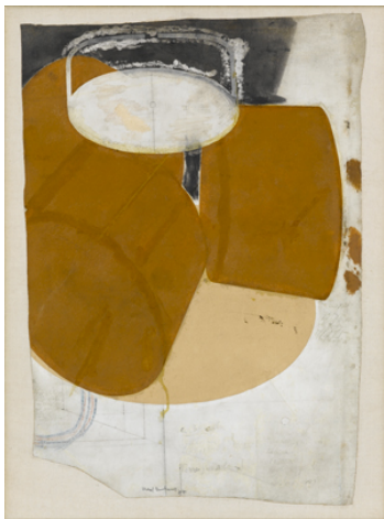
Marcel Duchamp Étude pour la broyeuse de chocolat, n°2

1912, huile sur toile, 89.5 x 55 cm Philadelphia Museum of Art, The Louise and Walter Arensberg Collection, 1950 © succession Marcel Duchamp / ADAGP, Paris 2014