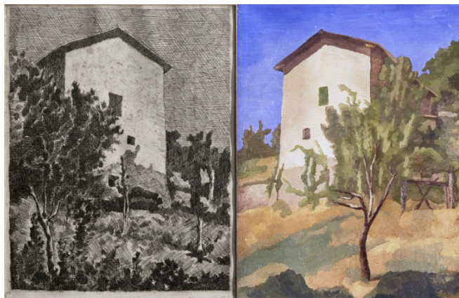
Giorgio Morandi, Paesaggio (1927), Etching, 26,1 x 20 cm, Firenze, Fondazione Spadolini

La rétrospective rassemble une centaine d'œuvres de Morandi, dont un autoportrait unique, prêtées par plus de 40 collections privées et publiques prestigieuses .