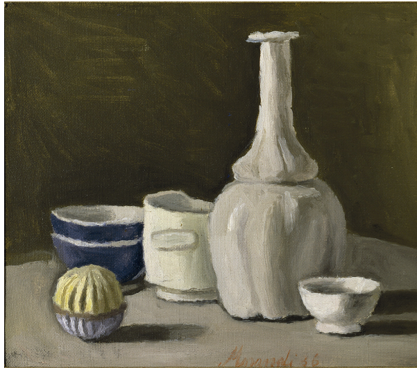
Giorgio Morandi, Natura morta (1936), Oil on canvas, 32 x 37 cm, Mamiano di Traversetolo (Parma), Fondazione Magnani Rocca

BOZAR rend hommage au maître moderniste italien Giorgio Morandi (Bologne, 1890 – 1964). Ses natures mortes subtiles, toujours réduites au strict essentiel, font partie des icônes de l'art moderne . Son sens de la couleur, du ton et de la composition sont aujourd'hui encore une source d'inspiration pour de nombreux artistes, écrivains et cinéastes .