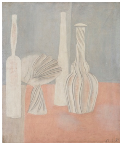
Giorgio Morandi, Natura morta , 1916, Oil on canvas, 65,5 x 55,5 cm, Private collection

Morandi a découvert les peintres métaphysiques Giorgio de Chirico et Carlo Carrà en 1918. Son bref engouement pour leur style a donné lieu à des images comme ce chef-d'œuvre : Nature morte , de 1918. S'il se dérobe au symbolisme et à l'atmosphère onirique des toiles de ses collègues, il partage cette poésie de l'énigme, intemporelle et étincelante.