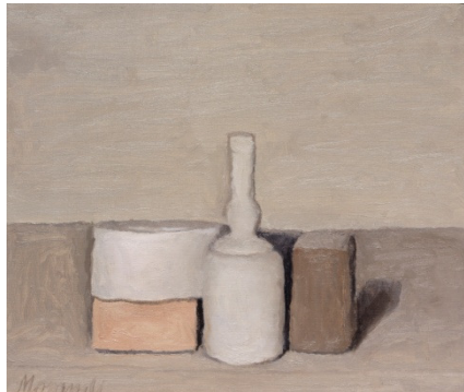
Giorgio Morandi, Natura morta (1955), Oil on canvas, 30 x 35 cm, Wassenaar. Caldic Collection

Morandi est l'un des artistes les plus caractéristiques et en même temps les plus énigmatiques du XX e siècle. Malgré la reconnaissance internationale dont il jouissait déjà de son vivant, il menait une vie retirée avec ses trois sœurs à Bologne.