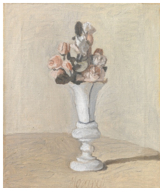
Giorgio Morandi, Fiori (1951), Oil on canvas, 43,4 x 37,3 cm, Firenze, Fondazione di Studi di Storia dell'Arte Roberto Longhi

Si tout au long de sa carrière, Morandi s'est attelé par intermittence à la représentation de fleurs, celle-ci semble occuper une importance accrue dans les années 1940 et 1950, à en juger par le nombre d'œuvres représentant des fleurs produites à cette époque.