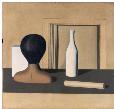
Giorgio Morandi, Natura morta , 1918, Oil on canvas, 68,5 x 72 cm, Milano, Pinacoteca di Brera, Collezione Jesi

Giorgio Morandi naît le 20 juillet 1890 à Bologne . Après le décès de son père en 1909, la famille emménage dans une maison de la Via Fondazza, où il vivra avec sa mère et ses trois sœurs jusqu'à sa mort en 1964.