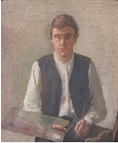
Giorgio Morandi, Autoritratto (1924), Oil on canvas, 53 x 44 cm, Firenze, Galleria degli Uffizi - Collezione degli autoritratti

Morandi travaillait toujours les mêmes thèmes – les natures mortes, les paysages, les fleurs – à l'exception, sporadique, de toiles peintes au milieu des années 1910. C'est à ce moment-là que, sous l'influence explicite de Cézanne comme l'indique le titre Baigneuses , il a étudié la figure humaine, sans jamais s'y intéresser vraiment.