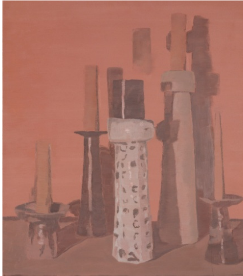
Luc Tuymans, Intolerance (1993), Oil on canvas, 80 x 70 cm, Private collection

Cette rétrospective est également l'occasion d'une rencontre que nous avons voulu réaliser avec le grand artiste contemporain Luc Tuymans, à qui nous avons demandé d'intervenir dans l'espace de l'exposition en nous proposant une sélection de ses peintures. Cette proposition fut acceptée avec enthousiasme.