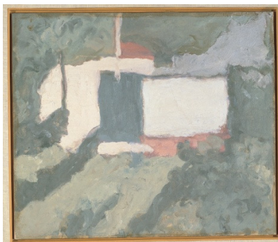
Giorgio Morandi, Paesaggio (1962), Oil on canvas, Bologna, Museo Morandi – Comune di Bologna

Tout au long de sa carrière, Morandi a peint des Paysages - des Apennins bolonais et de la Cour de la via Fondazza à Bologne - sévères, dépouillés de naturalisme et de tout élément descriptif, « austères », caractérisés par une réduction du « sujet qui tourne au ralenti », selon les définitions appropriées du critique d'art italien Roberto Longhi. Des Paysages muets, lieux sans présences humaines, qui laissent pourtant deviner celle de la main de l'homme.